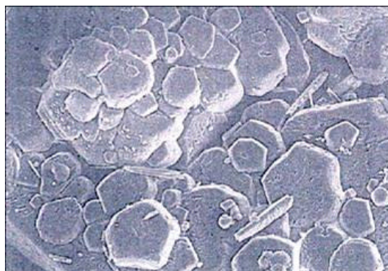
Mit Einsatz des Hydroflow-Kalkschutzsystems.

Die Kristalle sind deutlich runder und zusammengeballt, so können sie sich nicht fest ablagern und werden ausgespült.