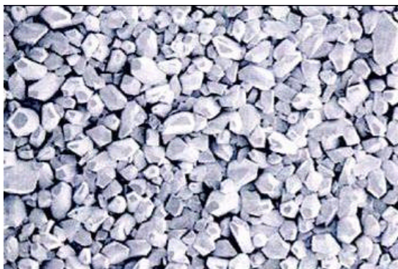
Ohne Einsatz des Hydroflow-Kalkschutzsystems.