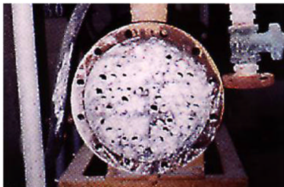
Röhren-Wärmetauscher vor Einsatz eines Hydroflow C 120 Kalkschutzgerätes.